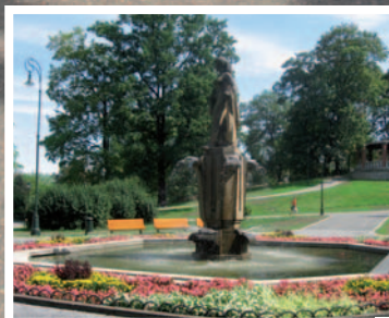
Opava a Racibórz hlavní města Euroregionu