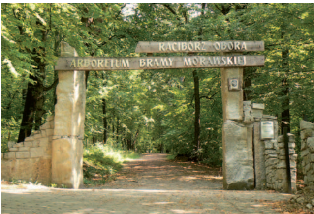
Na okraji Ratiboře se nachází Arboretum Moravské brány

po prohrané válce Rakouska s Pruskem se Opava stala hlavním městem tzv. rakouského Slezska a zároveň sídlem úřadů a zemské správy, zatímco Ratiboř se stala součástí Pruska. Od té doby se obě města vyvíjela v jiných státech.