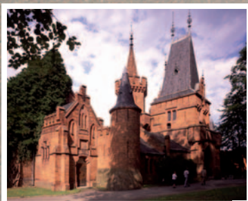
NEJ Euroregionu Silesia