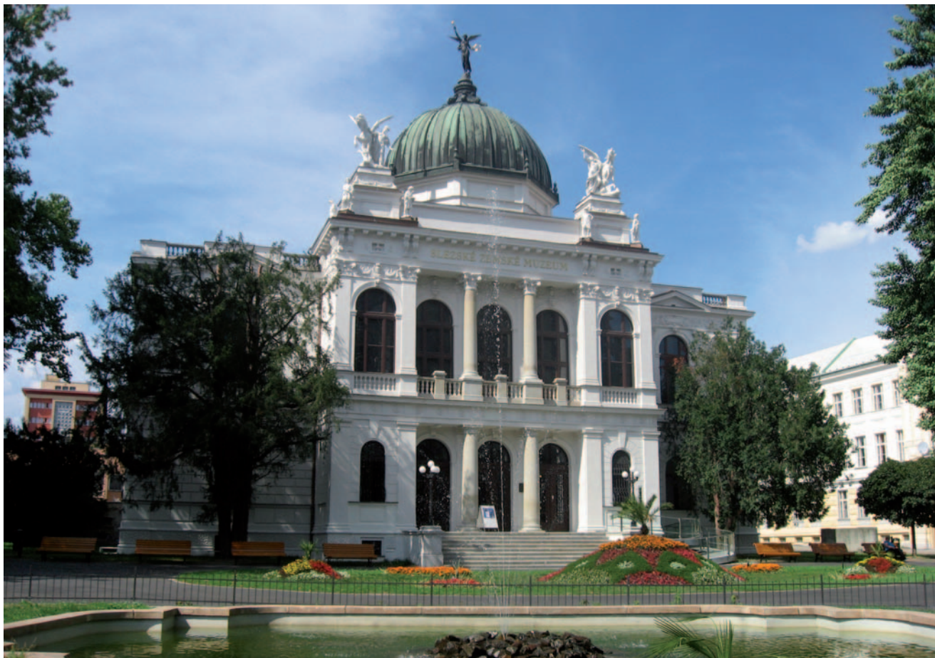
Slezské zemské muzeum v Opavě bylo založeno v květnu 1814 a je nejstarším muzeem v České republice. Předstihlo tak i vznik Národního muzea v Praze.

Euroregion SILESIA vznikl v roce 1998 jako sdružení samospráv z nejbližšího okolí dvou nejvýznamnějších měst česko-polského příhraničí – Opavy a Ratiboře (polsky Racibórz). Bylo to zcela přirozené, neboť obě města byla po staletí hlavními hospodářskými, politickými a kulturními středisky této části Slezska.