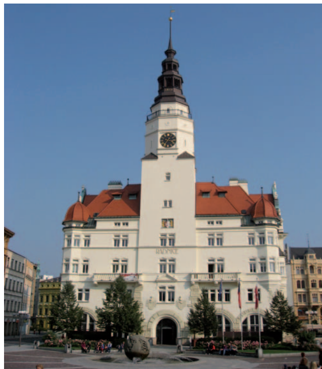
V budově historické městské věže, která je dominantou Opavy, je sídlo magistrátu města i české části Euroregionu Silesia

Město také podporuje rozvoj sportu - již řadu let jsou ratibořské kluby úspěšné v zápasu, plavání a v poslední době i v ženské kopané. K silným stránkám Ratiboře patří jeho tradice v oblasti vzdělávání na vysokoškolské úrovni. Od roku 2002 zde působí Státní vysoká odborná škola, která velmi dobře navazuje na tyto tradice. Právě tato vysoká škola podepsala v červenci 2012 oficiální smlouvu o spolupráci se Slezskou univerzitou v Opavě. Tato smlouva patří k četným příkladům spolupráce Opavy a Ratiboře. Spolupráce, která se nejen rozvíjí a posiluje na úrovni měst, ale především na úrovni jednotlivých institucí a samotných obyvatel. Spolupracující školy, sportovní kluby, kulturní sdružení a mnohé další instituce napomáhají tomu, že se obě historická města, byť leží na dvou stranách hranice, stále více „sblížují“. Příhraniční poloha Opavy a Ratiboře, hlavních center Euroregionu Silesia, obě města ke spolupráci přímo předurčuje. Je nutné mít na paměti, že od úrovně a kvality této spolupráce se může v budoucnu odvíjet rozvoj celého Euroregionu Silesia.