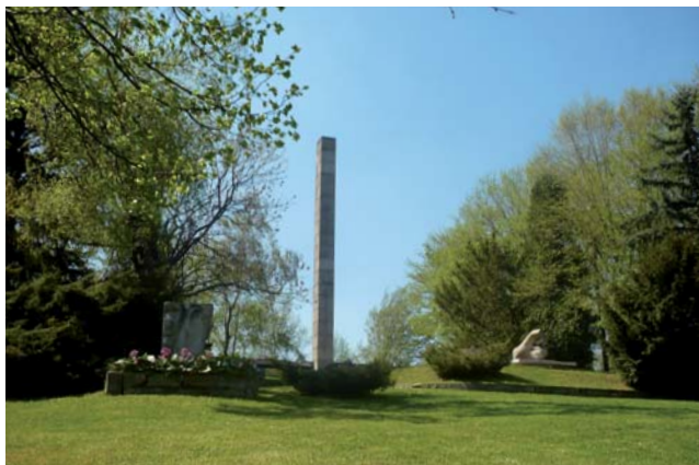
K významným místům Mikroregionu Matice Slezská patří Ostrá hůrka s Památníkem slezského odboje. V 19. a 20. století to bylo místo historických shromáždění slezského lidu a i dnes je tento památný kopec místem setkávání občanů k významným událostem českého Slezska.

Od roku 1990 je Ostrá hůrka místem setkávání občanů k významným událostem českého Slezska. V květnu 1998 se zde uskutečnilo setkání k 80. výročí tábora lidu konaného v roce 1918 a součástí tohoto setkání bylo také vyhlášení záměru založit Euroregion Silesia. Mikroregion Matice Slezská se stal členem euroregionu záhy po svém založení a jeho zástupce byl zvolen do užšího vedení české části euroregionu. Mikroregion je také členem Místní akční skupiny Opavsko a od roku 2012 také Národní sítě zdravotních měst.