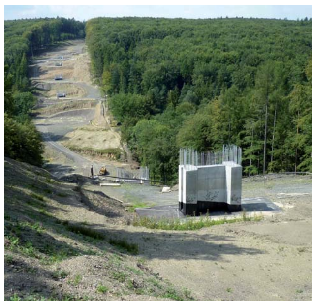
Na území Mikroregionu Matice Slezská je nyní realizován jeden z nevyznamnějších projektů poslední doby - výstavba nové čtyřpruhové komunikace mezi Opavou a Ostravou, která patří k páteřní síti nejen Euroregionu Silesia, ale celého Moravskoslezského kraje. Tato nová spojnice dvou největších měst euroregionu by měla být dokončena v průběhu roku 2015.

Členy mikroregionu je 14 slezských obcí na území mezi Opavou a Ostravou: Budišovice, Čavisov, Dolní Lhota, Háj ve Slezsku, Hlubočec, Horní Lhota, Hrabyně, Kyjovice, Mokré Lazce, Nové Sedlice, Pustá Polom, Štítina, Těškovice a Velká Polom. Mikroregion vznikl za účelem zlepšení a prohloubení spolupráce mezi těmito obcemi a také za účelem koordinace společných projektů. Jedním z prvních významných projektů mikroregionu byl vznik integrovaného informačního systému Mikroregionu Matice Slezská. Projekt podpořilo Ministerstvo pro místní rozvoj ČR a v jeho rámci byla vybudována mikroregionální počítačová síť a byla založena místní informační centra připojená k internetu. Mezi další významné projekty patří cyklostezka, která propojila Mikroregion Matice Slezská se sousedním Mikroregionem Hlučínsko, zhotovení digitálních barevných ortofotomap jednotlivých členských obcí a také pasportů komunikací na jejich území.