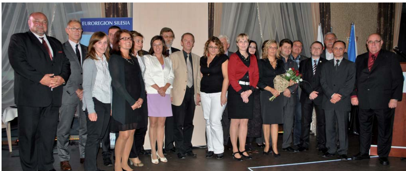
K 15. výročí Euroregionu Silesia přijeli popřát i představitelé všech ostatních euroregionů česko-polského příhraničí