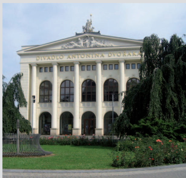
Divadlo Antonína Dvořáka v Ostravě je jednou ze dvou divadelních scén, které tvoří Národní divadlo moravskoslezské. Druhou scénou je pak Divadlo Jiřího Myrona.

Beskydské divadlo Nový Jičín ( www.beskydskedivadlo.cz ) je významnou kulturní institucí města s více stoletou tradicí. Divadlo uvádí širokou škálu divadelních žánrů od oper a operet až po experimentální divadelní projekty, má také speciální nabídku pro školy.