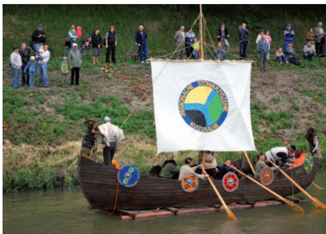
K největším akcím na Odře patří každoročně pořádané „Pływadło“.

S rostoucím zájmem o turistické využití Odry a také s cílem většího zapojení místních obyvatel do provozování vodácké turistiky se na vyvíjených aktivitách začaly podí-