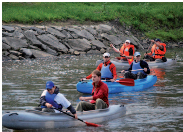
V rámci Fondu mikroprojektů Euroregionu Silesia bylo realizováno mnoho projektů zaměřených na rozvoj vodácké turistiky na Odře.

let i obce ležící u řeky. Jednou z prvních byla obec Krzyżanowice, která v letech 2008 – 2009, společně s městem Bohumínem a sdružením Posejdon z Věřňovic, zrealizovala projekt „Červen - měsíc přátelství na soutoku Odry s Olší“. V rámci projektu byla pořízena projektová dokumentace pro vybudování pěti nástupních míst pro vodáky na Odře a Olši. Dále byl vydán vodácký průvodce s podrobnou mapou Olše a Odry na hraničních úsecích. A co je nejdůležitější, díky pořízení kánoí včetně příslušenství a zřízení půjčovny vodáckého vybavení, bylo iniciováno pravidelné sjíždění Odry a Olše na kánoích. Od té doby si zájemci mohou půjčit vodácké vybavení v kanoistickém klubu „Meander“ v Zabelkowě nebo u dobrovolných hasičů ve Starém Bohumíně.