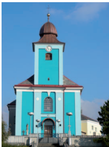
Dominantou obce Větrkovice je kostel Nanebevzetí Panny Marie z 19. stol.

Obec Větrkovice, která se nachází v okrese Opava, se rozkládá po obou stranách historické moravsko-slezské zemské hranice – větší část obce leží ve Slezsku, menší část zvaná Nové Vrbno na Moravě. Větrkovice patří mezi málo historických sídel, která mají zachovanou svou zakládací listinu (r. 1298). V současné době v obci žije 750 obyvatel. Je zde mateřská škola a 1. stupeň základní školy. V obci pracuje mnoho aktivních spolků, které v průběhu celého roku pořádají nejrůznější akce. K známým tradičním akcím patří „Větrkovská traktoriáda“, závody na podomácku vyrobených traktorech, nebo Konec masopustu, pořádaný místním Sbohem dobrovolných hasičů. Od roku 2005 obec spolupracuje se slovenskou partnerskou obcí Turčianské Kľačany.