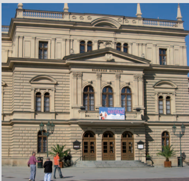
Slezské divadlo v Opavě patří k nejstarším divadelním scénám v České republice. Základní kámen Zemského divadla v Opavě, budovy dnešního Slezského divadla, byl položen před více než 210 lety – 1. května 1804.

„Domino je hra se spoustou možností, kombinací, vazeb a souvislostí. Hra pro čistou radost ze hry, hra s napětím, nečekanými možnostmi, kombinacemi, překvapení-