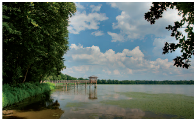
Lesy obklopující rybníky v jižní části obce Nędza tvoří přírodní rezervaci Łęczczok, jednu z nejkrásnějších polských lesních a rybníčních rezervací.

Gmina (obec) Nędza je vesnická obec se 7 tisíci obyvateli, která leží ve Slezském vojvodství, v ratibořském okrese. Území obce zaujímá 5 714 hektarů, a tak se řadí mezi středně velké obce Slezského vojvodství. Obec se skládá z těchto částí: Nędza, Zawada Książęca, Babice, Górki Śląskie, Ciechowice, Szymocice a Łęg. Mezi všemi vesnickými obcemi ratibořského okresu se vyznačuje největší mírou zalesnění a zároveň nejmenším podílem zemědělské půdy. Všechny lesy leží na území CHKO Cysterskie Kompozycje Rud Wielkich. Lesy obklopující rybníky v jižní části obce tvoří přírodní rezervaci Łęczczok, jednu z nejkrásnějších polských lesních a rybníčních rezervací. Obec je právem označována za ekologicky nejmístnější obec v celém Slezském vojvodství.