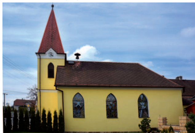
Kaple v Jezdkovicích

Obec Jezdkovice, podobně jako Větrkovice, se nachází v okrese Opava a rozkládá se jak na území Slezska, tak na území tzv. moravských enkláv ve Slezsku. Založení obce je datováno rokem 1250. V letech 1618–1619 byl v obci postaven renesanční zámek, který je dnes sídlem obecního úřadu, klubovny mládeže a knihovny. K budově zámku přiléhá zámecký park, který slouží k pořádání kulturních akcí a trávení volného času. Do roku 1993 byly Jezdkovice součástí obce Stěbořice, dnes jsou samostatnou obcí s dvěma stovkami obyvatel.