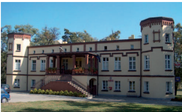
Kulturní středisko „Zámeček“ v Czernicy.

Gmina (obec) Gaszowice je vesnickou obcí ležící ve Slezském vojvodství, v Rybnickém okrese. Vznikla v roce 1973. Ke konci roku 2013 v obci žilo 9180 občanů. Obec má 5 částí (tzv. sołectwa): Gaszowice, Szczerbice, Piecie, Czernica a Łuków Śląski. Na jejím území jsou 2 mateřské školy, 3 základní školy 1. stupně a 1 základní škola 2. stupně. Díky své poloze má obec dobré dopravní spojení s městy Rybnik, Rydułtowy a Ratiboř. Na území obce se nachází mnoho lesních ploch, kterou jsou součástí komplexu sousedícího s nádrží Zalew Rybnicki. Obec leží v ratibořsko-osvětimské kotlině, 8 kilometrů západně od Rybniku v ochranném pásmu CHKO Cysterskie Kompozycje Krajobrazowe Rud Wielkich. Obec se může pochlubit řadou míst, která stojí za návštěvu. Patří k nim mj. zámeček z 19. století v Czernici, v kterém dnes sídlí kulturní středisko.