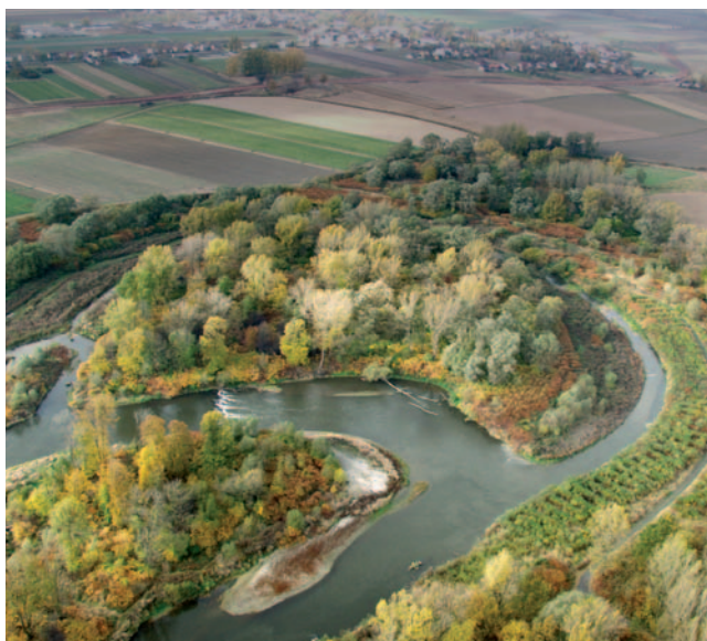
Hraniční meandry Odry jsou evropským přírodním fenoménem

se o dva projekty předložené obcí Kuźnia Raciborska – „Odra – řeka, která spojuje“ a „Dokumentace pro výstavbu nástupního místa příležitostí k rozvoji vodácké turistiky v polsko-českém příhraničí“ a jeden projekt Ratiboře – „Odra místem vodáckých dobrodružství pro celou rodinu“. V rámci toho posledního projektu se konaly čtyři nezávislé vodácké akce: sprint na trase od nástupního místa v Ratiboři k lávce na Odře, slalom, okruh kolem Ratiboře, aneb obeplutí města po Odře a kanálem Ulga, a také přeshraniční vodácká akce – sjíždění řeky z Bohumína do Ratiboře.