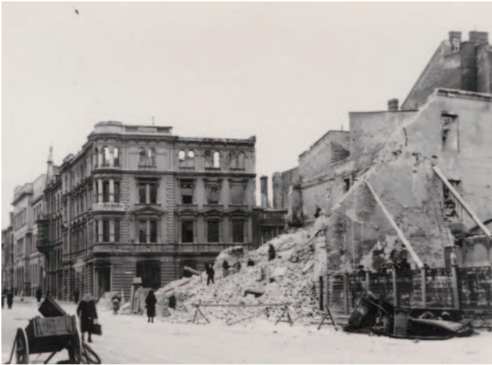
Podle historiků byla Opava po 2. světové válce nejzničenějším městem současné České republiky.

V letošním roce uplynulo přesně 70 let od ukončení druhé světové války, největšího válečného konfliktu v dějinách lidstva. Důsledky této války, zejména pak jejich posledních měsíců se tragicky dotkly i slezsko-moravského příhraničního území, čili území dnešního Euroregionu Silesia. Ve skutečnosti zdejší obyvatelstvo poznalo negativní následky „velkých dějin“ již roku 1938, kdy došlo po mnichovské dohodě k připojení Hlučínska a Opavy, tzv. Sudet, k Německu a zdejší lidé se nedobrovolně stali obyvateli Třetí říše. Když Německo 1. září 1939 vyhlásilo válku Polsku, začali obyvatelé Hlubčicka, Rybnicka, Ratibořska a Hlučínska již přímo pociťovat dopady Hitlerem vedené války, a to zejména po útoku Sovětského svazu. K největším dramátům patřila povinnost vojenské služby mužů, což v tomto případě znamenalo povolání do Wehrmachtu a nasazení ve válce prakticky na všech frontách.