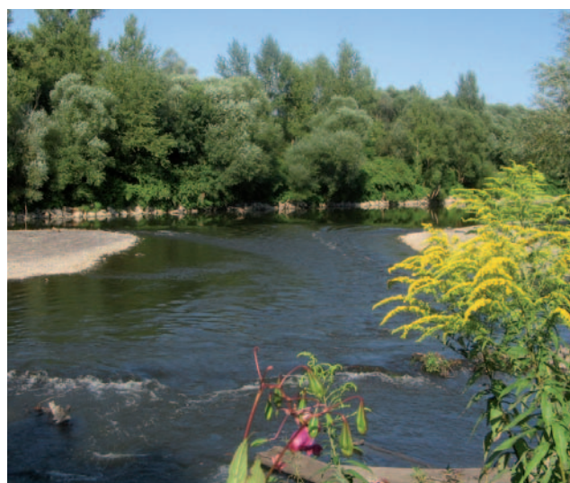
Řeka Odra – symbol Euroregionu Silesia

Od pradávných dob lidé osidlovali místa v blízkosti řek. Řeky umožňovaly ekonomický, urbanistický a kulturní rozvoj mnoha měst, včetně Ratiboře, Bohumína, Ostravy. Po mnoho staletí Odra určovala identitu těchto měst a spoluvytvářela jejich dějiny. Byla také velmi často příčinou pohrom a neštěstí, kdy rozvodněná ničila lidský majetek a vyžádala si i lidské oběti. Díky stále lepšímu schopnostem soužití lidí s řekou však lze očekávat, že bude místem, které bude podporovat udržitelný rozvoj okolních území. Vznikající vodní nádrž Racibórz Dolny a již existující poldr Buków by měly účinně omezit výskyt takových katastrofických povodní, jakou byla například ta v roce 1997. Odra využívaná turisticky a rekreačně a v budoucnu možná i hospodářsky je a stále bude symbolem této části Slezska, symbolem celého Euroregionu Silesia.