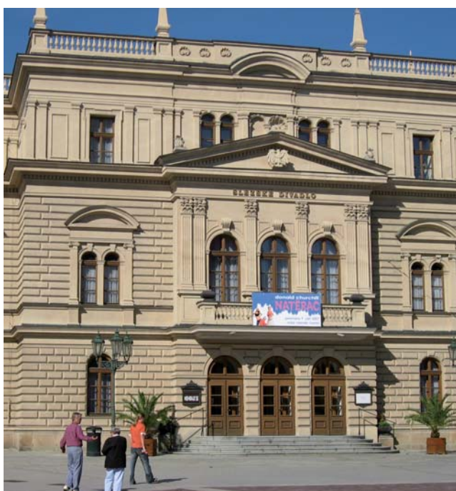
Kamień węgielny Teatru Krajowego w Opawie, budynku dzisiejszego Teatru Śląskiego położono 210 lat temu – 1 maja 1804 roku.