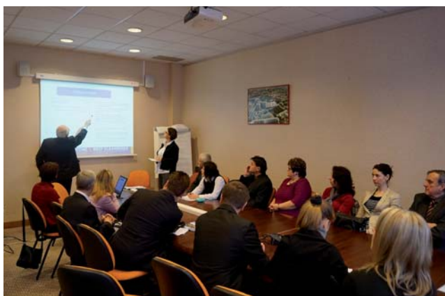
W drugim dniu wizyty miało miejsce spotkanie z dyrektorem szpitala w Dunkierce, który przedstawił uczestnikom trzy projekty współpracy transgranicznej francuskich i belgijskich zakładów opieki zdrowotnej.