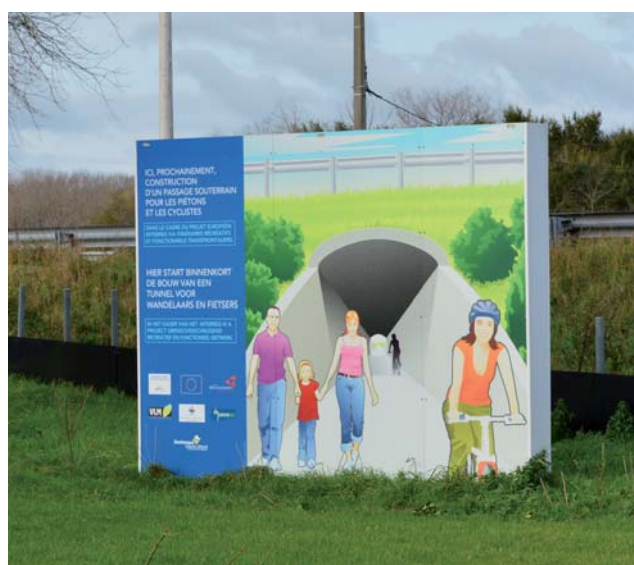
Uczestnicy wyjazdu studyjnego mogli także zobaczyć w terenie produkty projektu „Wypoczynkowe i funkcyjne trasy transgraniczne”.