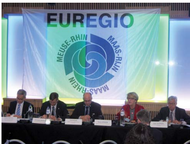
Współorganizatorem walnego zgromadzenia i corocznej konferencji SERG był belgijsko-holenderski Euroregion Meuse-Rhin. Podczas walnego zgromadzenia wszystkie z sześciu polsko-czeskich euroregionów przedstawiły wspólną prezentację. W corocznej konferencji uczestniczyła m. in. Danuta Hübner, przewodnicząca Komisji ds. Rozwoju Regionalnego Parlamentu Europejskiego.

Na początku listopada 2013 roku przedstawiciele euroregionów uczestniczyli w dorocznej konferencji Stowarzyszenia Europejskich Regionów Granicznych (SERG) w belgijskim Liège. Przed konferencją odbyło się walne zgromadzenie, które było okazją do bliższego poznania działalności tego ogólnoeuropejskiego stowarzyszenia. Na posiedzenie przedstawiciele wszystkich sześciu polsko-czeskich euroregionów przygotowali wspólną prezentację.