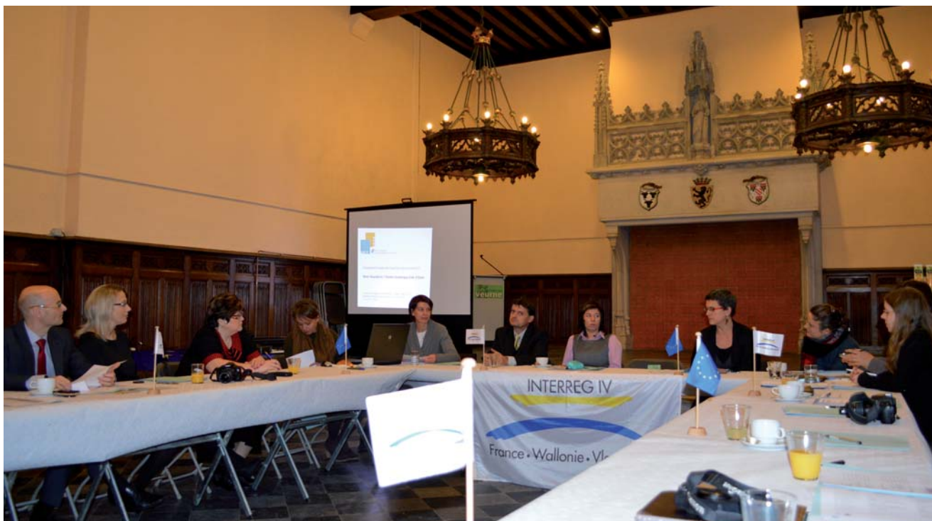
W pierwszym dniu wizyty w EUWT West-Vlaanderen / Flandre – Dunkerque – Côte d'Opale odbyło się całonocne spotkanie robocze ze współdyrektorkami i partnerami EUWT.