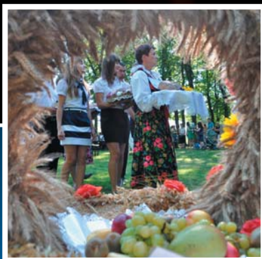
Lokalne Grupy Działania w Euroregionie Silesia