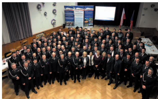
16 lutego 2018 roku w Chuchelnej odbyło się inauguracyjne spotkanie przedstawicieli wszystkich polskich i czeskich jednostek OSP zaangażowanych w projekt.

W ramach projektu realizowanego do końca 2019 roku zostaną zakupione 4 nowe samochody ratowniczo-gaśnicze (2 dla polskich i 2 dla czeskich jednostek) oraz inny sprzęt techniczny dla 19 jednostek. Realizowane będą także działania mające na celu wzmocnienie transgranicznej gotowości i zdolności do podejmowania działań ratowniczych przez ochotnicze straże pożarne, obejmujące 4 wspólne ćwiczenia taktyczne realizowane na przemian po polskiej i czeskiej stronie, 2 turnusy wspólnych zgrupowań w Centralnej Szkole Pożarniczej z programem szkoleń teoretycznych i praktycznych ćwiczeń pod nazwą „Uniwersytet strażaka – ochotnika” oraz wspólne spotkania robocze wszystkich zaangażowanych jednostek. Ważnym elementem projektu jest również analiza systemu wspólnej ochrony przygranicznych gmin w Euroregionie Silesia oraz opracowanie krótkiego i zrozumiałego podręcznika wspólnej ochrony, będącego pomocą dla jednostek OSP do przeprowadzania działań po drugiej stronie granicy.