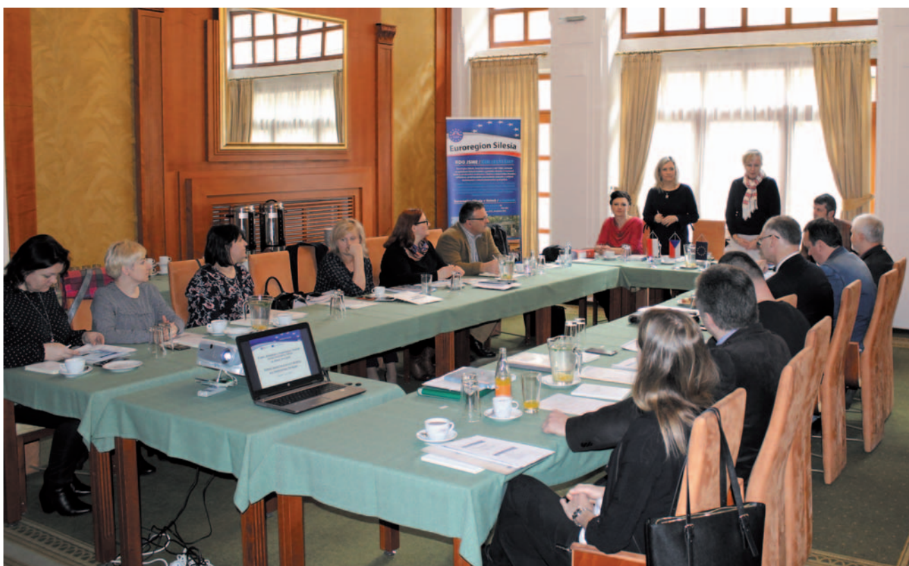
Dnia 13 marca 2018 roku w Opawie odbyło się kolejne spotkanie grupy roboczej ds. wdrażania Strategii Rozwoju Euroregionu Silesia.

Prosperujący polsko-czeski region, który wspiera ideę jedności europejskiej oraz wspólnie rozwija swoją przyszłość w oparciu o współpracę partnerską.