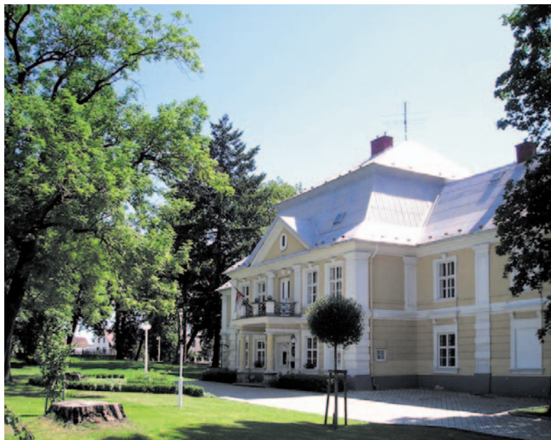
Barokowy pałac z 1771 roku zlokalizowany w centrum gminy Slatina, w którym dziś mieści się urząd gminy, biblioteka i pomieszczenia reprezentacyjne gminy z salą ślubów.