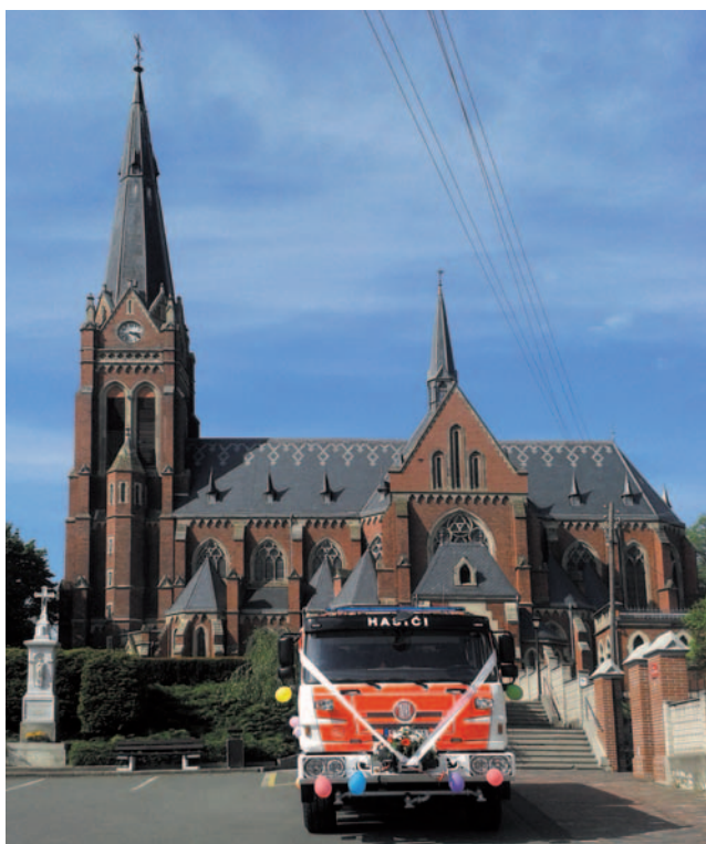
Uroczysty chrzest nowego pojazdu ratowniczo-gaśniczego dla jednostki OSP Sudice odbył się 28 kwietnia 2018 roku

EVROPSKÁ UNIE / UNIA EUROPEJSKA EVROPSKÝ FOND PRO REGIONÁLNÍ ROZVOJ EUROPEJSKI FUNDUSZ ROZWOJU REGIONALNEGO