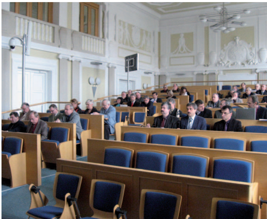
V aule Slezské univerzity v Opavě se konají zasedání Valné hromady české části Euroregionu Silesia.