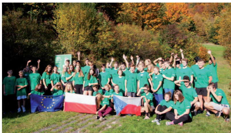
„Budme offline“ a „Život začíná tam, kde končí Wi-Fi“ byly názvy dvou turnusů společných pětidenních pobytů, na kterých se žáci partnerských škol učili jak „přežít“ bez internetu.