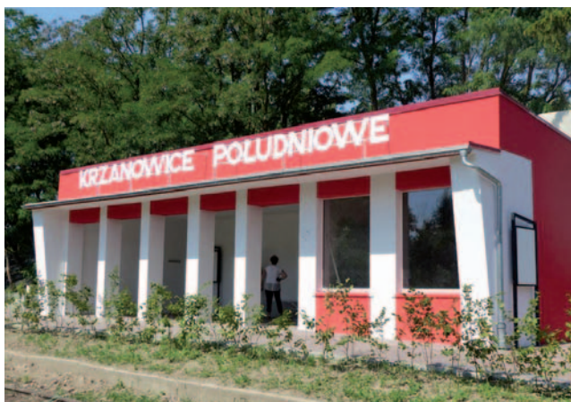
Rekonstrukcí chátrající, nevyužívané nádražní budovy v Krzanowicích bylo vytvořeno jedno z odpočinkových míst na stezce rodu Lichnovských.

těchto obcí. Obce mají dobré vzájemné dopravní spojení a jejich okolí je ideální pro víkendovou cykloturistiku, jedinou nevýhodou je tak nedostatečná doprovodná infrastruktura. A právě na tento problém byl zaměřen společný projekt obou obcí. V rámci projektu byla v Krzanowicích zrekonstruována bývalá nádražní budova na trase Ratiboř – Opava, kde vznikl cyklistický přístřešek, který poslouží i jako úkryt v případě nepříznivého počasí. V přímém sousedství objektu byla postavena venkovní posilovna a speciální místo ke grilování. Kromě toho byl pořízen mobiliář, jako jsou lavičky, odpadkové koše, stojany na kola či infotabule. Díky těmto aktivitám je kdysi opuštěné a nevyužité nádraží opět přístupné a využívané pro účely cestovního ruchu. V Chuchelné bylo připraveno speciální prostranství o rozloze 410 m 2 , které slouží jako odpočinková zóna pro cyklisty. Celý areál je vybaven lavičkami, stojany na kola a odpadkovými koši. V rámci projektu se uskutečnila cyklovýlet „Stezkou rodu Lichnovských“ a na závěr v rámci propagace celého projektu byla uspořádána speciální konference. Celkové výdaje projektu dosáhly výše 95 595,88 eur, dotace z Evropského fondu pro regionální rozvoj pro oba partnery celkem činila 60 000 eur.