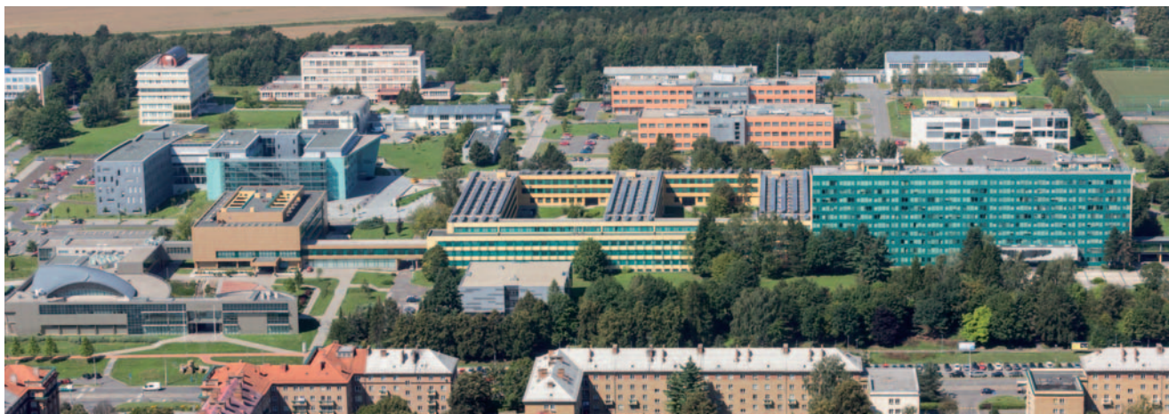
Kampus Vysoké školy báňské – Technické univerzity Ostrava, který kromě výuky nabízí ubytování, stravování, sportovní a kulturní výtahy a řadu dalších služeb včetně univerzitní mateřské školy, patří k největším ve střední Evropě.

V roce 1953 byla v Opavě otevřena Vyšší pedagogická škola, která vzdělávala učitele pro 2. stupeň základních škol. Její činnost převzal v roce 1959 zřízený Pedagogický institut, jehož sídlem se stala Ostrava. Roku 1964 získal tento institut statut samostatné Pedagogické fakulty v Ostravě, z které pak v roce 1991 vznikla samostatná univerzita. V současné době má univerzita šest fakult: kromě zmiňované pedagogické fakulty je to fakulta filozofická, přírodovědecká, umění, sociálních studií a lékařská. Součástí univerzity jsou dva instituty (Evropský výzkumný institut sociální práce a Institut zahraničních studií) a dále Ústav pro výzkum a aplikace fuzzy modelování. Univerzitní knihovna Ostravské univerzity poskytuje své služby studentům, akademikům i široké veřejnosti. V bakalářských, magisterských a doktorských studijních programech studuje přibližně 9 600 studentů.