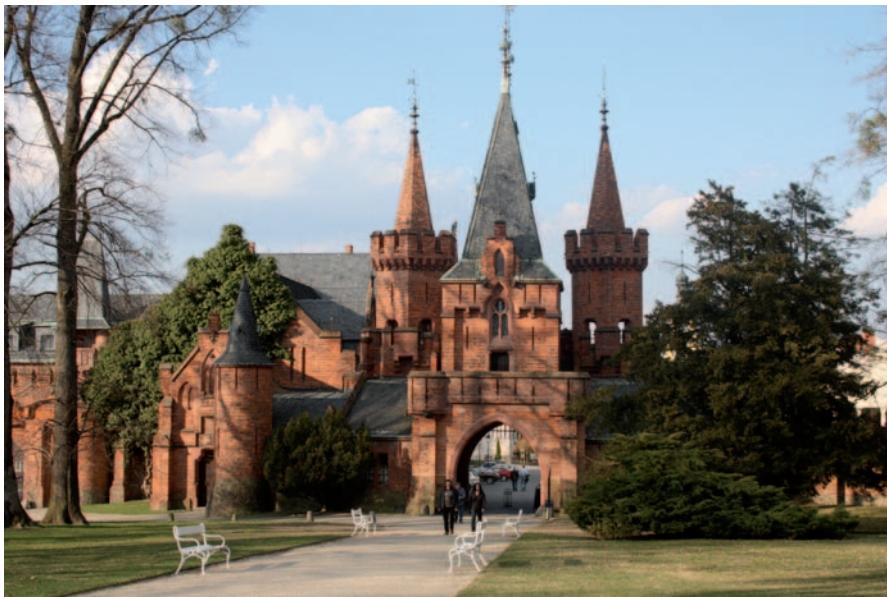
Zámecký areál v Hradci nad Moravicí tvoří Bílý zámek, novogotický Červený zámek s hlavní vstupní branou (na snímku) a park v anglickém stylu. V držení hradeckého panství se vystřídal 8 knížat a hrabat Lichnowských v šesti generacích.

V oblasti území Horní Odry bylo těchto rodů hodně, jako příklady bychom mohli uvést knížata von Ratibor, hrabata von Saurma-Jeltsch, Gashin, Donnersmarck, Lichnowski, Rothschild a Eichendorff. Jedním z nejvýznamnějších aristokratických rodů v Horním Slezsku byl rod Lichnowských . Tato rodina, jejíž význam rostl již od 15. století, se významně podílela na hospodářském a kulturním rozvoji této části Horního Slezska a zanechala po sobě nejen četné pozůstatky materiální kultury v podobě rezidencí, kostelů nebo hospodářských objektů, ale také stopy kulturní aktivity. Nejvýznamnější postavou rodu byl Karl Max von Lichnowsky – ambasador Německého císařství v letech 1912-1914, jediný německý diplomat stavějící se proti snahám o vypuknutí války a současně vynikající hospodář pečující o rozvoj svého rodového panství při zachování důstojných pracovních podmínek pro své pracovníky. Dalším známým představitelem šlechtického rodu byl Feliks von Lichnowsky – politik, voják, publicista, první poslanec za Ratibořsko zvolený do parlamentu ve Frankfurtu nad Mohanem, kde nakonec tragicky zemřel – byl zavražděn.