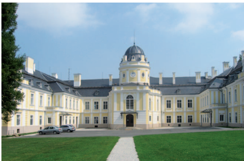
Historie zámku v Šilheřovicích se datuje od konce 18. století, kdy rod Eichendorffů nechal na místě dřívější renesanční tvrz postavit zámek. Původně se jednalo o klasicistní zámek, který byl později pseudobarokně přestavěn. Od roku 1844 do roku 1945 bylo panství v majetku rodiny Rothschildů.

Při putování po území Horního Slezska můžeme hlouběji poznávat nejen zmíněné představitele místních zemských elit, ale také další osobnosti, které ovlivnily rozvoj a stávající sociálně-hospodářskou a kulturní podobu regionu.