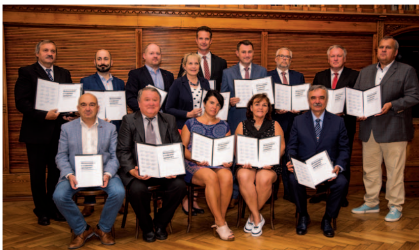
Slavnostní podpis memoranda dne 28. července 2021 se symbolicky konal na území Euroregionu Nisa, který si jakožto historicky nejstarší euroregion ve střední a východní Evropě v roce 2021 připomíná 30 let od svého založení.

lépe spolupracovat na přípravě přeshraničních dotačních programů na období 2021-2027 a v rámci těchto programů na přípravě fondů malých projektů tak, aby byly evropské prostředky využity na skutečné potřeby těchto regionů a jejich obyvatel. Neméně důležitým úkolem pro Asociaci je usilování o snížení administrativní zátěže fondů malých projektů, které euroregiony tradičně spravují a díky kterým jsou spolufinancovány především projekty people-to-people. Ambicí Asociace je také pozvednutí role euroregionů v regionálním rozvoji ČR, zejména pak jejich ukotvení v zákoně o podpoře regionálního rozvoje, jejich zapojení do procesu tvorby národních strategických dokumentů v oblasti regionálního rozvoje či začlenění Asociace do Národní stálé konference, která zajišťuje vzájemnou provázanost a koordinaci územních partnerů při realizaci Dohody o partnerství a programů spolufinancovaných z evropských fondů.