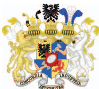
Erb rodu Rothschildů

Neméně významným rodem byli Rothschildové . Salomon M. Rothschild, z vídeňské větve rodiny židovských bankéřů známé po celém světě, se v 1. polovině 19. století velmi zajímal o tuto část Horního Slezska a zakoupil zde majetky mj. v Šilheřovicích a Chaňupkách. A prostřednictvím svých investic v Ostravě se stal motorem pro rozvoj průmyslu a formování sociálního a kulturního života celého regionu. Zasloužil se např.