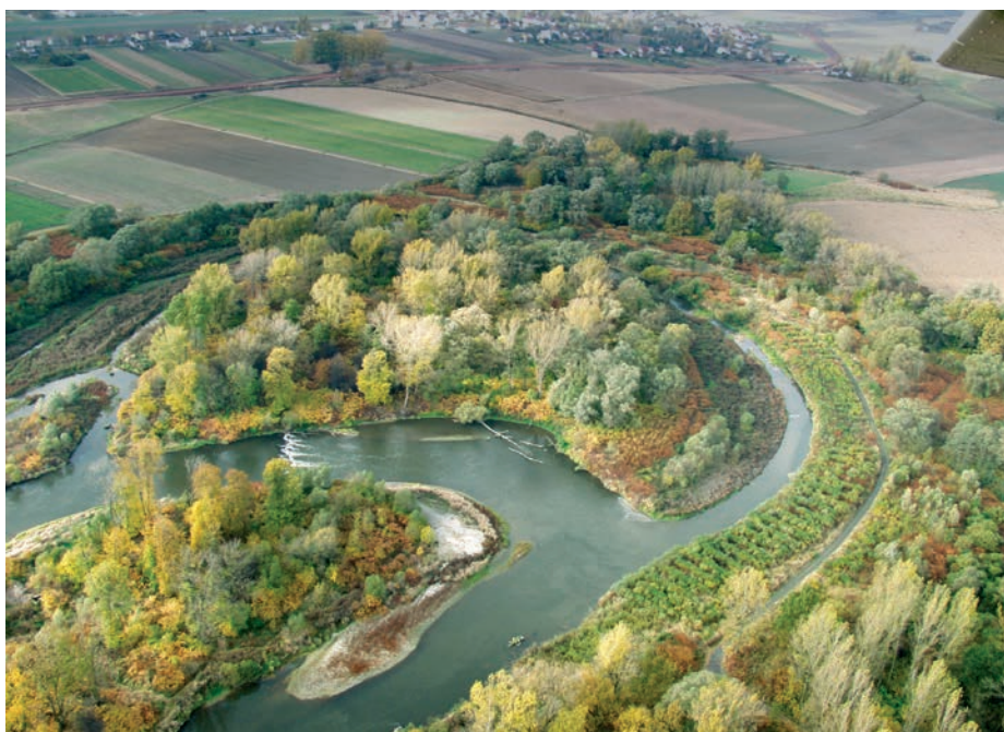
Graniczne Meandry Odry

Sezon wodniacki na Odrze trwa od wiosny do jesieni. Organizacją spływów zajmują się samorządy i lokalni pasjonaci kajakarstwa. Ponadto istnieje możliwość indywidualnego wypożyczenia sprzętu w miejscowych klubach kajakowych. Do największych imprez wodniackich na Odrze należą Pływadło oraz Meander Orient Express.