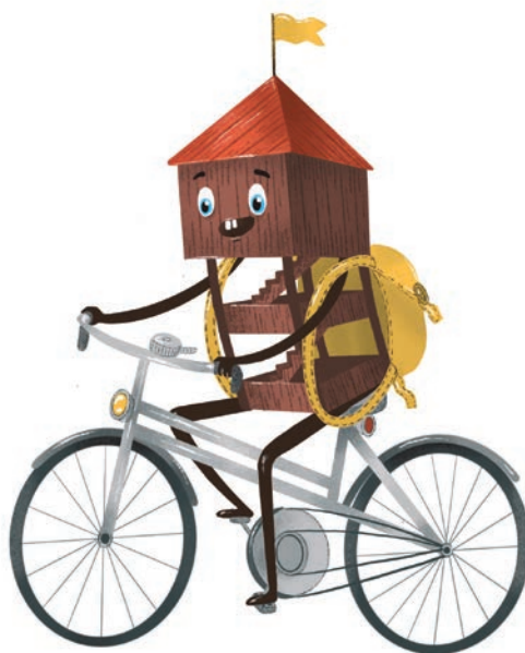
Illustrations © Karolína Mlčochová, 2021

Meandrach Odry w Chałupkach czy niemal trzydziestometrowa wieża widokowa Halaška w Budišovie nad Budišovkou, z której roztaczają się fantastyczne widoki od Jesioników po Beskidy – to wszystko, a nawet jeszcze więcej, oferuje szlak. Od czerwca bieżącego roku przygotowany jest, nie tylko dla prawdziwych pasjonatów wież widokowych, program lojalnościowy z wieloma ciekawymi nagrodami. Na obiektach szlaku umieszczono tabliczki z informacjami i kodem QR, za pośrednictwem którego osoby zainteresowane mogą przystąpić do programu lojalnościowego na stronie internetowej Silesianki. Do tabliczek są przymocowane także metalowe pieczętki, które można odrysować do książki wędrowca. W wybranych miejscach można zdobyć też tradycyjną pieczętkę. Dla tych, którzy wezmą udział w programie, czekają różne nagrody promocyjne, gry oraz modele 3D poszczególnych wież widokowych. Nagrody można odebrać w wybranych punktach, np. w Informacji Turystycznej w Opawie, Ostrawie i Odrach, w Powiatowym Muzeum Ziemi Głubczyckiej w Głubczycach oraz w biurze polskiego sekretariatu Euroregionu Silesia w Raciborzu. Zainteresowani mogą też we wszystkich punktach odebrać bezpłatnie materiały promocyjne – oprócz wspomnianej książki wędrowca do zbierania tradycyjnych pieczętek dostępna jest też mapa całego szlaku oraz broszura w czterech wersjach językowych, oferty tematycznych wycieczek pieszych, rowerowych, samochodowych i dla rodzin