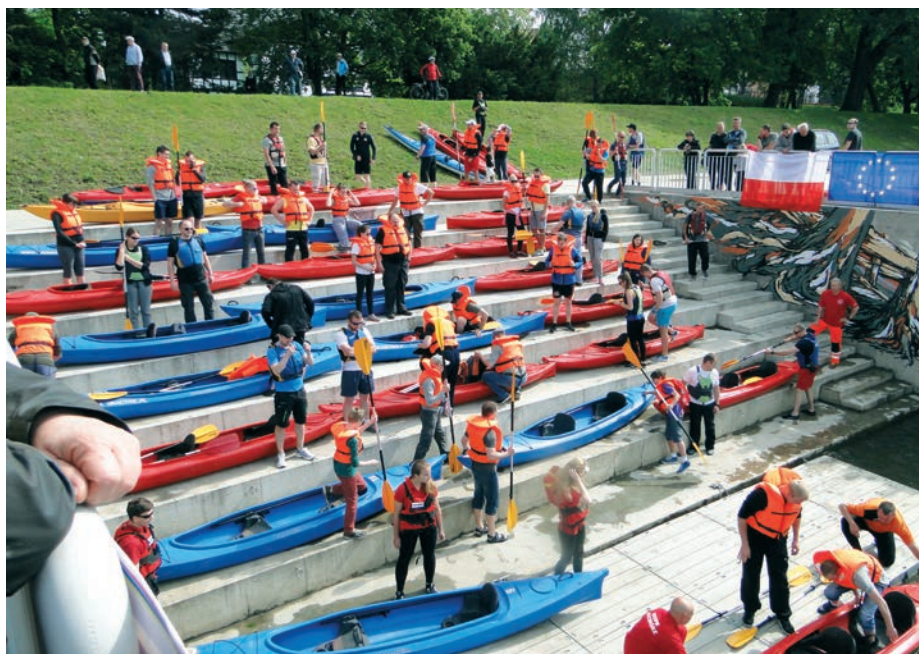
Jedna z imprez wodniackich na Odrze w Raciborzu

wprawni kajakarze powinni przeznaczyć około 6 godzin. Na tym odcinku można w kilku miejscach bezpiecznie zakończyć lub przerwać spływ przy wybudowanych w ostatnich latach przystaniach: w Zabełkowie i Krzyżanowicach. Samo dopłynięcie do Raciborza będzie obecnie problema-