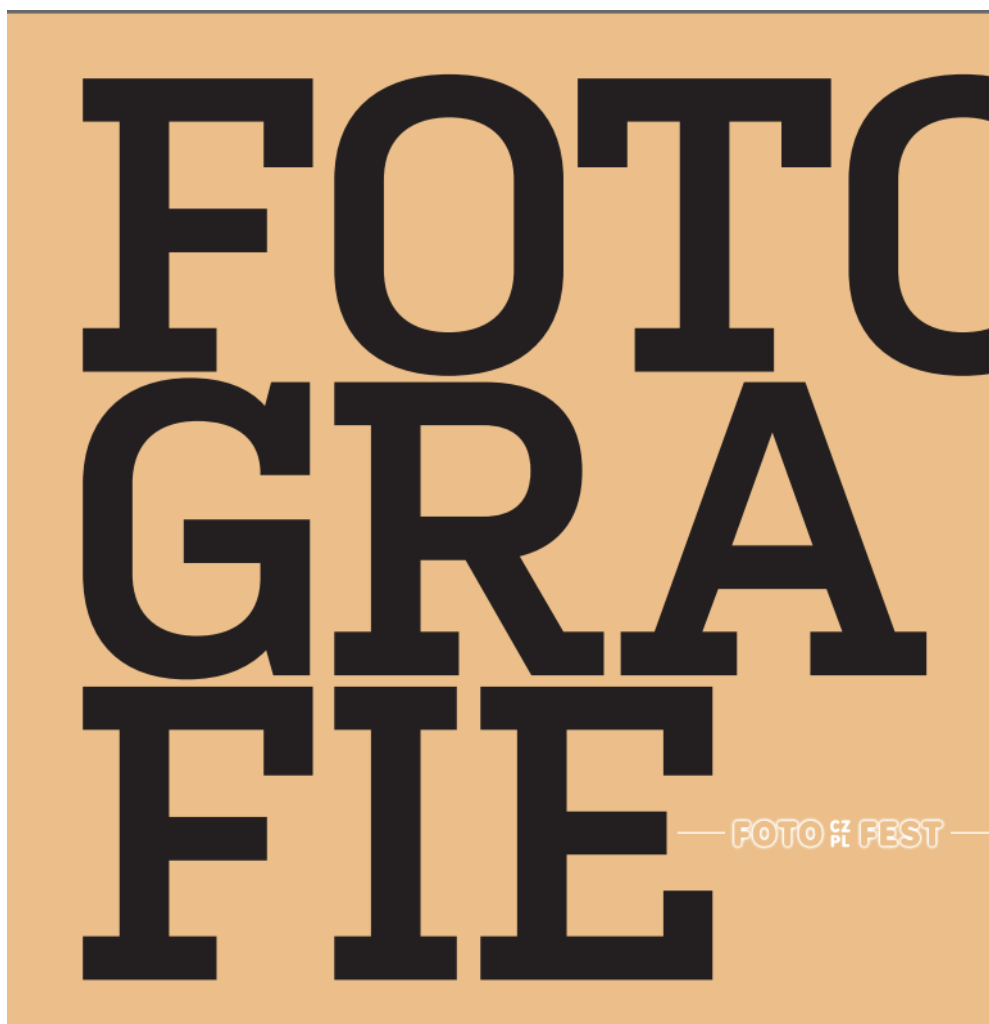
Ukázka přebalu publikace fotografií