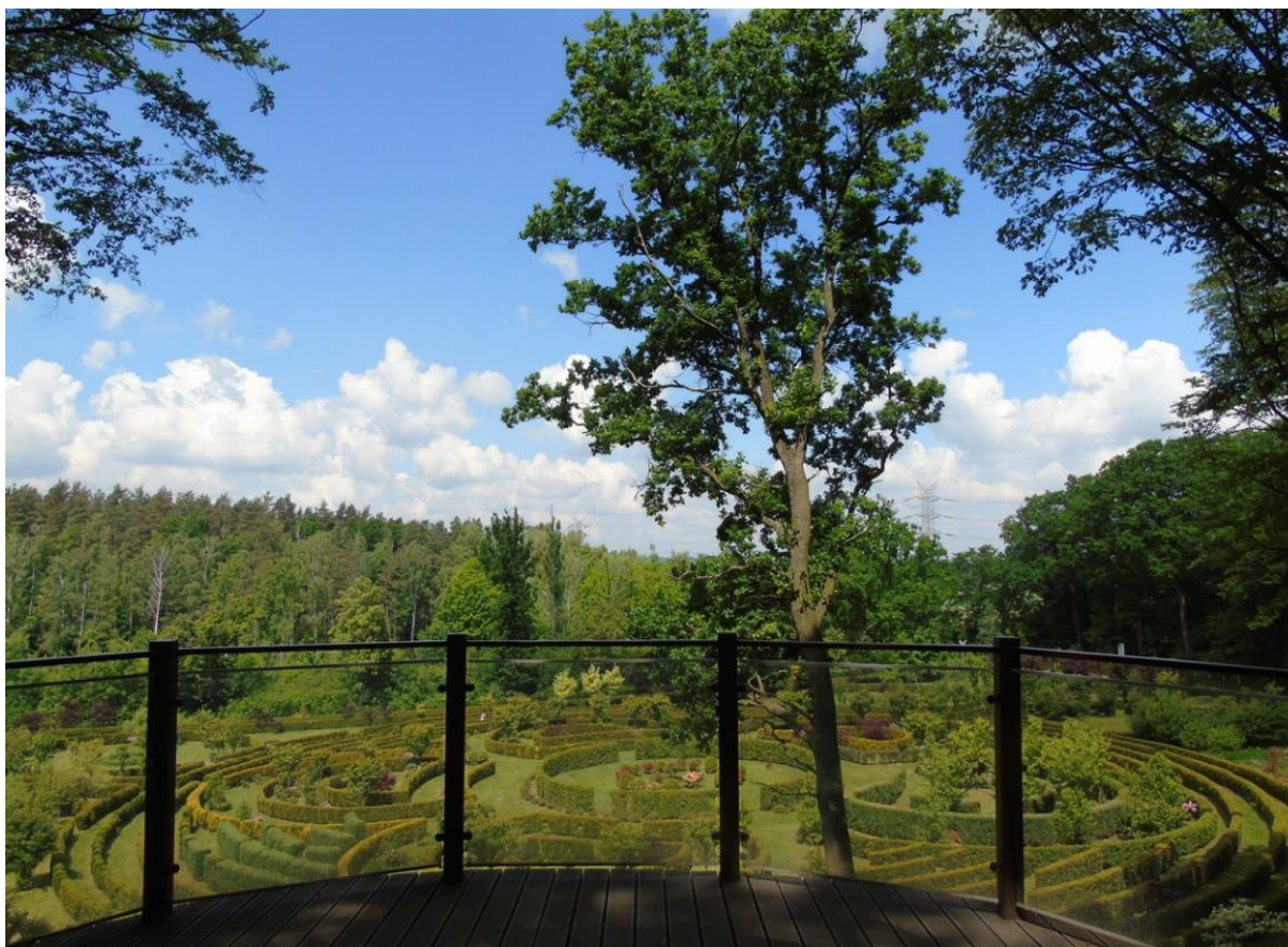
Vyhlídkové místo v Arboretu Moravské brány

V rámci projektu byla realizována řada aktivit mající za cíl přilákat české i polské turisty k návštěvě objektů stezky. Byl spuštěn věrnostní program založený na sbírání razítek, vytvořena byla dvojjazyčná webová stránka. Byly natištěny mapy stezky s nabídkou tematických výletů (na kole, pro rodiny s dětmi). Uskutečnila se také konference propagující vzniklou stezku a proběhlo slavnostní otevření jednotlivých rozhleden a vyhlídkových míst.