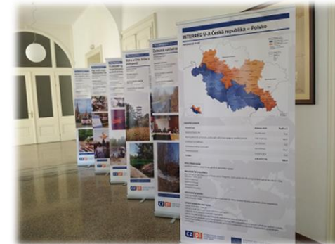
Putovní výstava, Výroční aktivita,